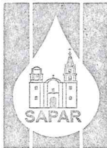
Sistema de Agua Potable y Alcantarillado de Romita, Gto